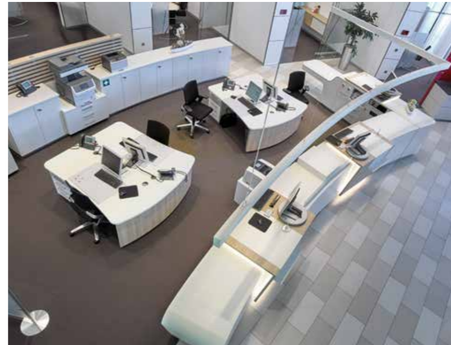
▲ Blick von oben auf den Service-Bereich mit geschlossener Theke