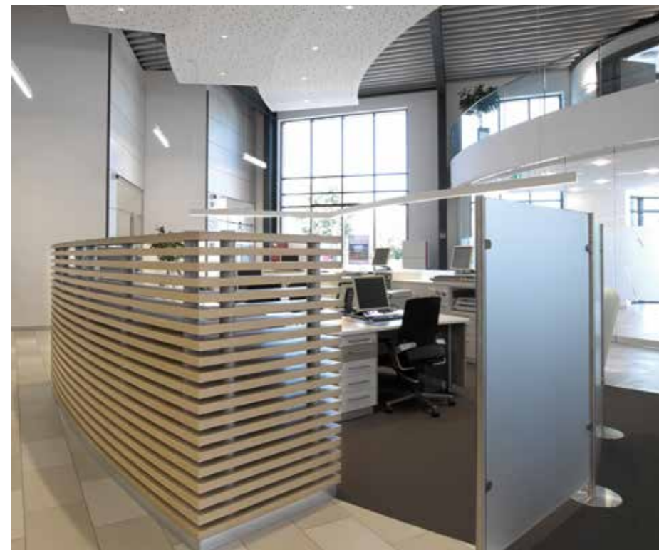
▲ Rückansicht des Service-Bereichs mit Sichtschutz