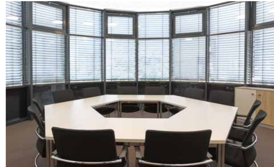
▲ Runder Konferenzraum im ersten Obergeschoss