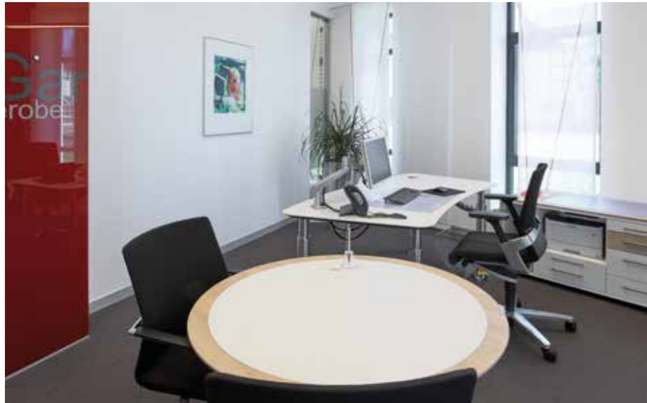
▲ Die sechs Beratungsräume sind funktional und individuell eingerichtet