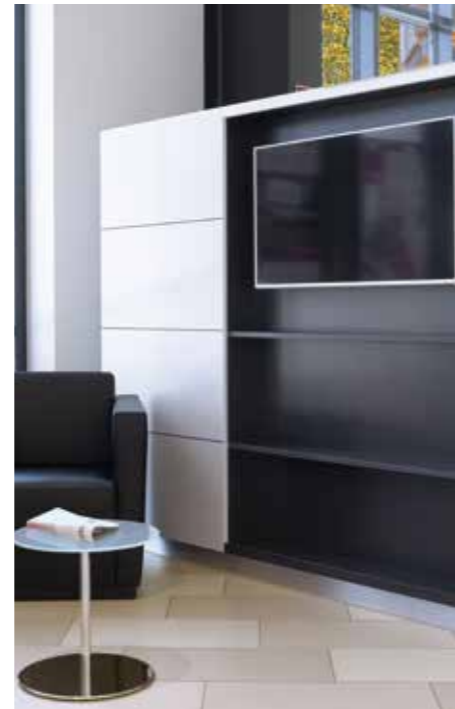
▲ Wartebereich mit Medienschrank