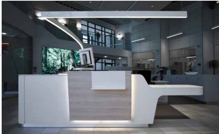
▲ Akzentbeleuchtung oberhalb der Theke und ...