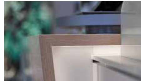
▲ Detail der Theke in Holz, Lack und Corian

staltung gelegt. Um die Nachhallzeit trotz des großen Raumvolumens auf ein angenehmes Maß zu reduzieren, wurden insgesamt drei in sich gestaffelte Deckensegel ausgeführt. Sie sind die Fortführung der innenarchitektonischen Ideen in der dritten Dimension und wurden in Trockenbau als Lochdecken ausgebildet. Gleichzeitig sind sie Träger der Grundbeleuchtung über Einbau-Downlights.