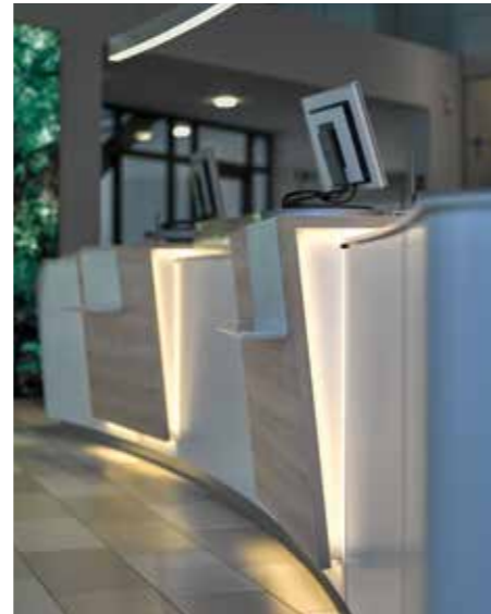
▲ ... in die Theke integriert