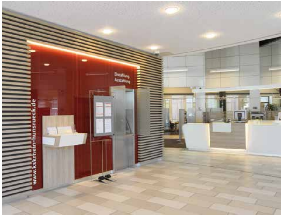
▲ Die SB-Zone in klassischem Sparkassen-Rot

Neben den hohen Anforderungen an die ästhetische Ausgestaltung wurde besonderer Wert auf eine gute Akustik und die Lichtge-