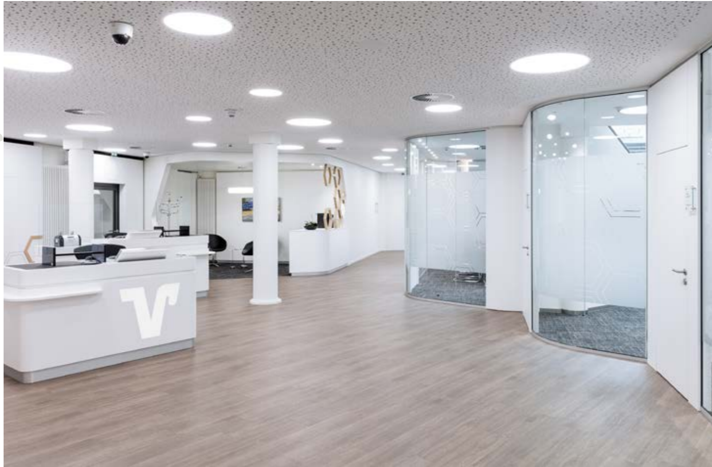
▲ Blick auf Service und die gerundeten Glastrennwände der Beratungsräume in der Geschäftsstelle

Die Fläche der ehemaligen Hauptstelle der Volksbank Eifel eG in Prüm wurde komplett neu gegliedert. Entstanden ist eine Dreiteilung, mit der die Genossenschaftsbank ihren Mitgliedern und Kunden nun ein Rundum-sorglos-Erlebnispaket bietet. Neben der klassischen Bankfiliale gibt es eine digitale Beratungsgeschäftsstelle unter dem Label der VR Eins und ein Café als echter Treffpunkt – ergänzt um einen künstlerisch gestalteten Innenhof, der Raum für Veranstaltungen bietet.