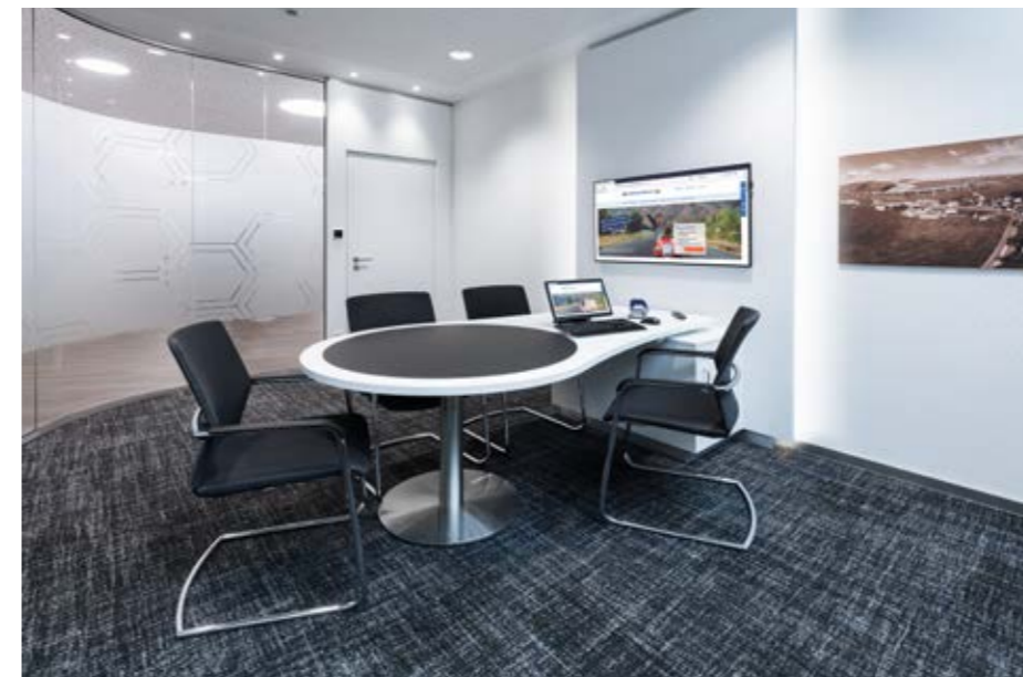
▲ Beratungsräume der klassischen Geschäftsstelle