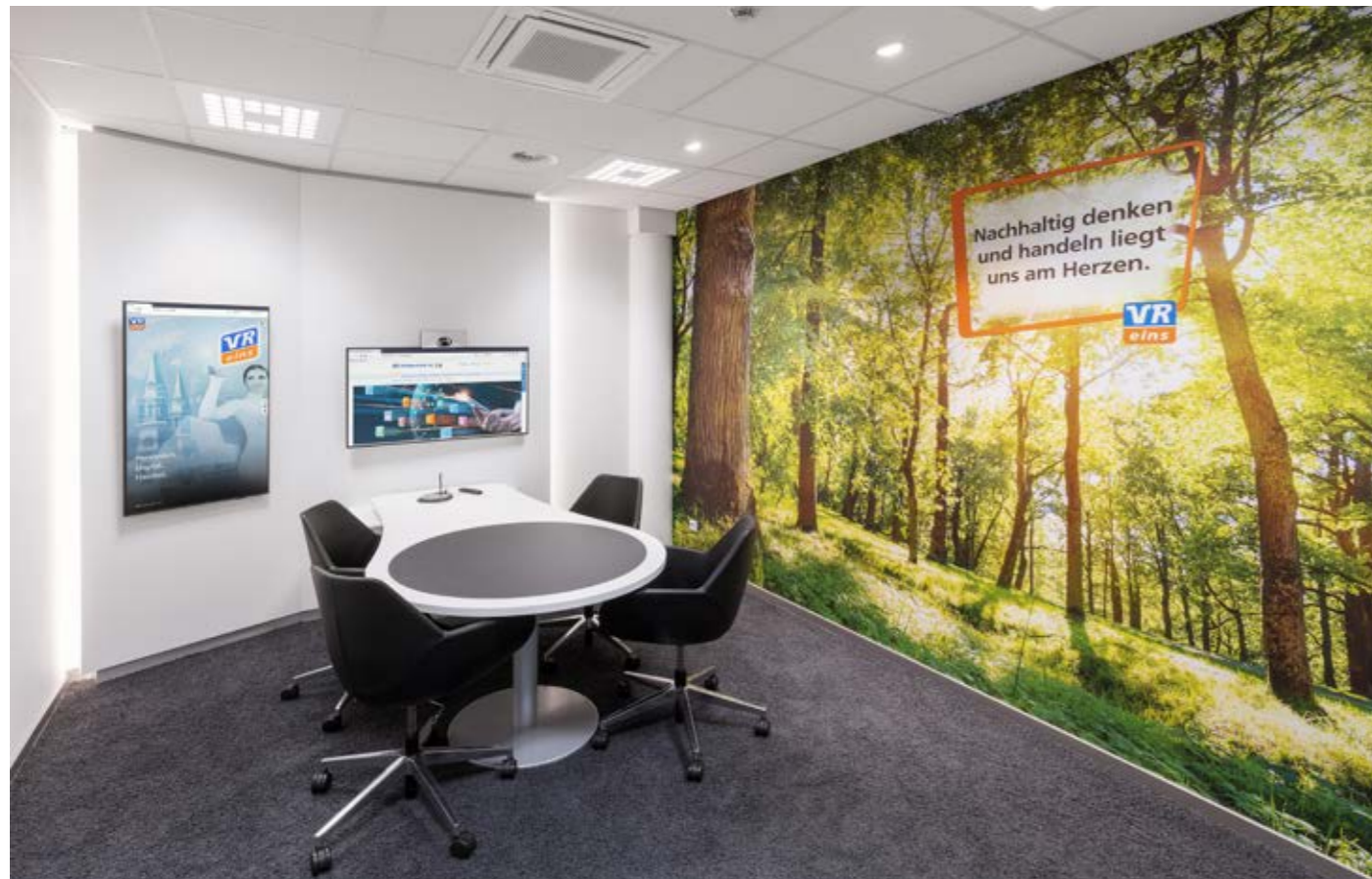
▲ ... oder Nachhaltigkeit, und ist mit jeweils zwei Bildschirmen ausgestattet

sondern sehr professionelle Voraussetzungen für einen Fremdbetrieb schaffen.