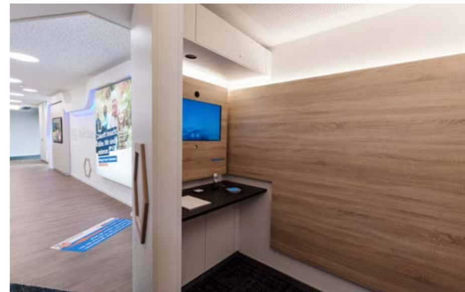
▲ Videoberatung für den Service außerhalb der Schalteröffnungszeiten