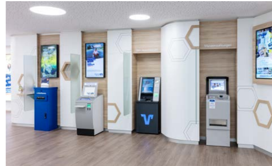
▲ SB-Wand mit E-Briefkasten und Geldversorgung