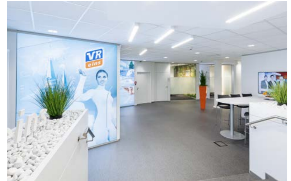
▲ Eingang zur VR Eins - die Beratungsfiliale

Ebenso zentral wie der Eingang stellt sich auch der Innenhof dar, der durch eine Komposition