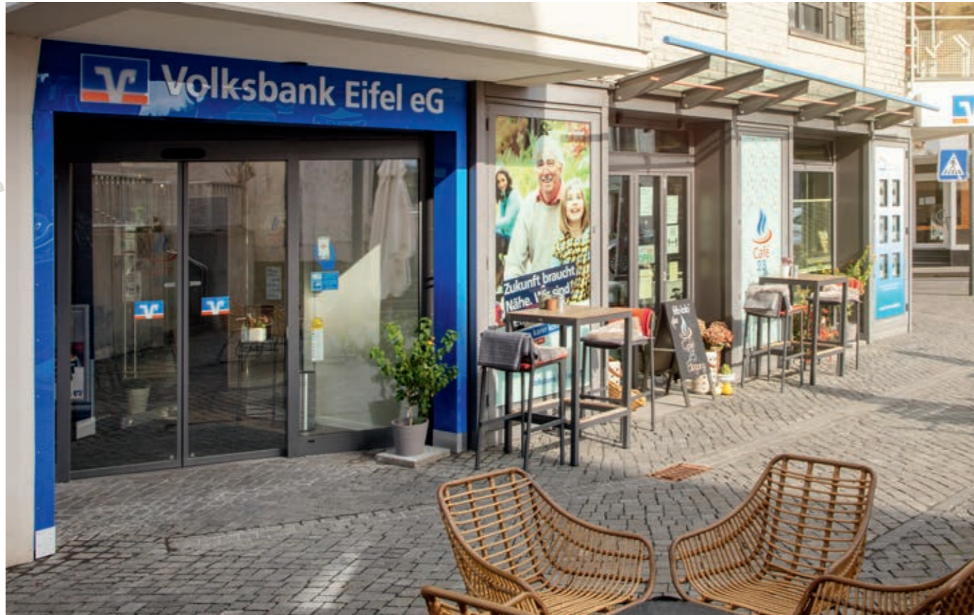
▲ Der Eingang zur Volksbank und das Café bilden eine Einheit