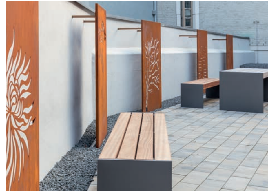
▲ Innenhofgestaltung mit hinterleuchteten Cortenstahl-Elementen

aus künstlerischen Elementen aus Cortenstahl und atmosphärischer Beleuchtung eine hochwertige und attraktive Ausgestaltung erfahren hat. Er dient nicht nur als Aufenthalts- und Ruheort für die Mitarbeiter, sondern auch als Veranstaltungsbereich – ein großer Vorteil in der Coronazeit, wo Aufenthaltsbereiche im Freien für größere Gruppen gefragt sind.