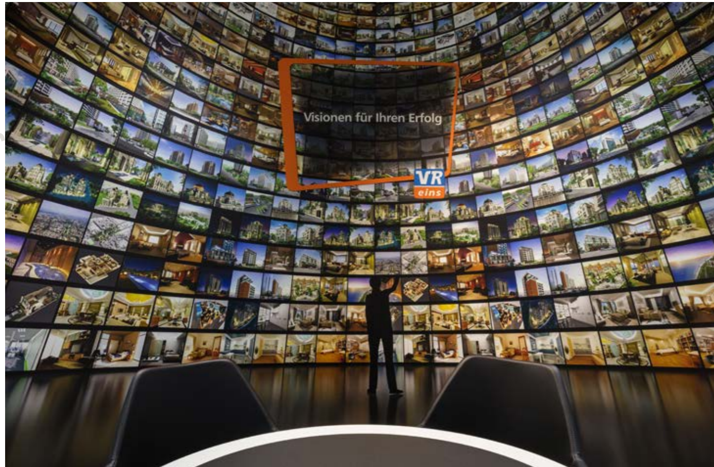
▲ Jeder Beratungsraum der VR Eins verfügt als Highlight über eine großflächige Fototapete zu einem aktuellen Thema, wie z. B. Zukunftsvisionen ...