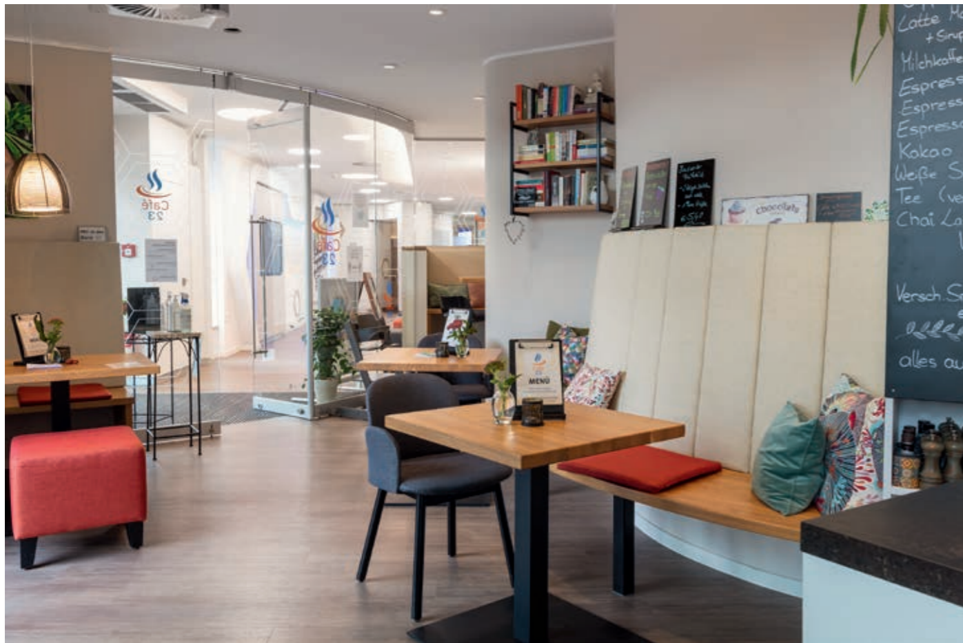
▲ Blick vom Café in den Eingangsbereich der Bank