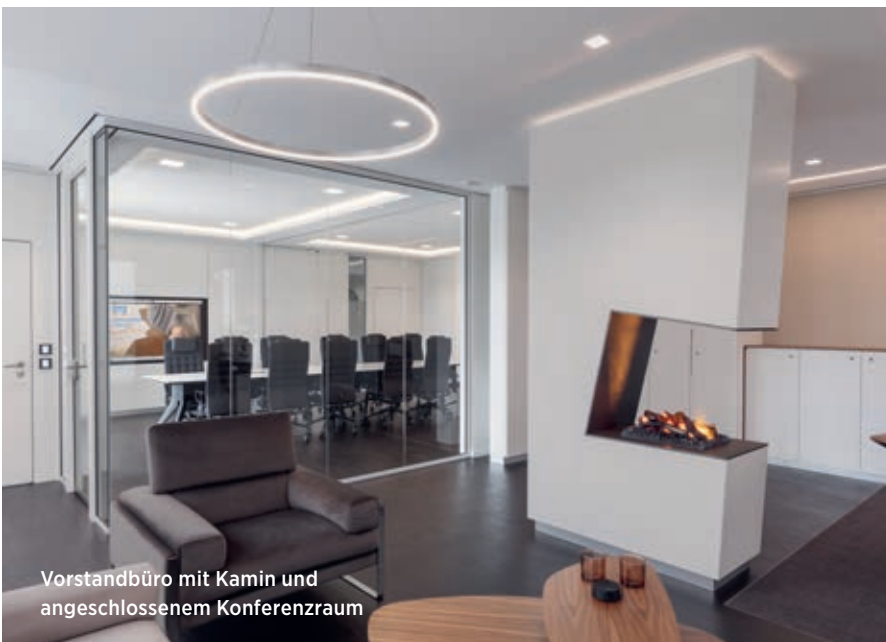
Vorstandsbüro mit Kamin und angeschlossenem Konferenzraum