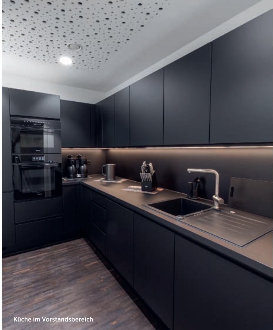
Küche im Vorstandsbereich

In der Regel finden sich die Geschäftsräume einer Bank im Erdgeschoss. Bei der Raiffeisenbank Eifel eG in Simmerath ist es anders: Die neue Vorstandsetage und die Beratungsebene wurden im Staffelgeschoss eines Neubaus realisiert, der ansonsten als Wohngebäude dient. Die Wohnungen befinden sich ebenfalls im Besitz der Bank und wurden altersgerecht und barrierearm gestaltet. Zudem verfügt das Gebäude über zwei Tiefgaragen, eine für die Bewohner:innen und eine für