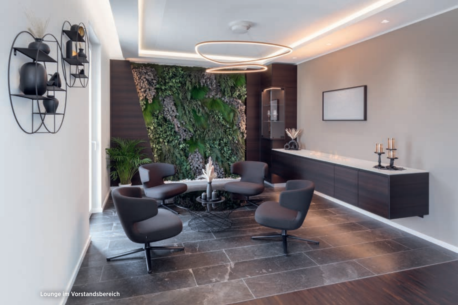
Lounge im Vorstandsbereich