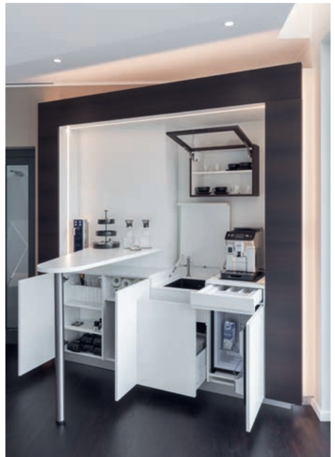
Kaffee-Bar – multifunktionales Möbel mit Feinheiten