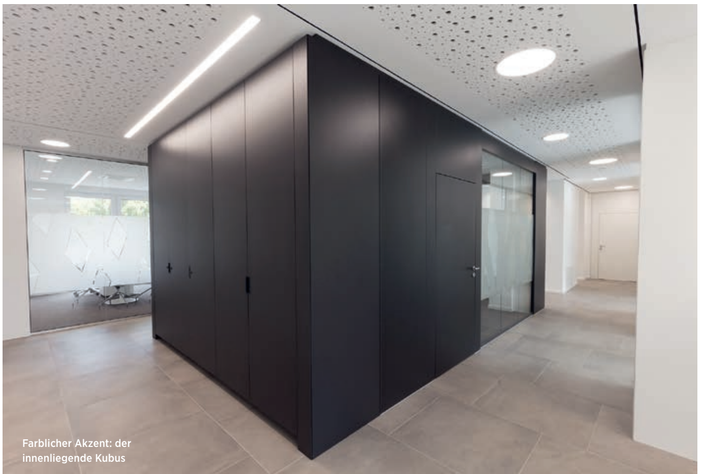
Farblicher Akzent: der innenliegende Kubus