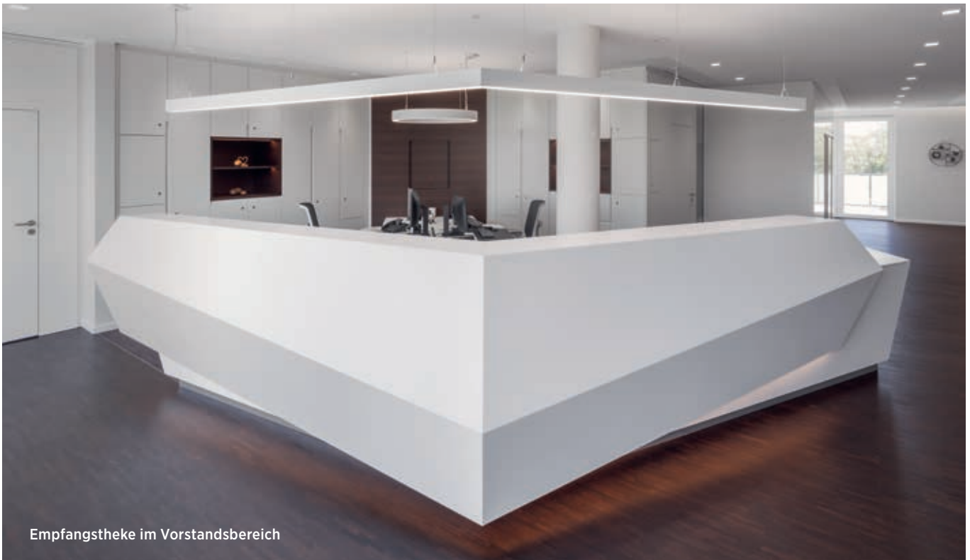
Empfangstheke im Vorstandsbereich