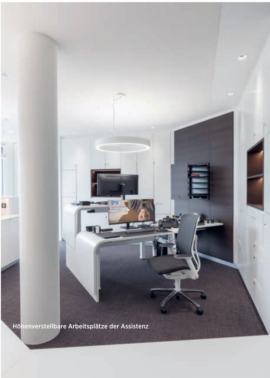
Höhenverstellbare Arbeitsplätze der Assistenz

die Mitarbeitenden sowie die Kundschaft der Bank. Das Staffelgeschoss ist über das Treppenhaus oder per Aufzug direkt aus der Tiefgarage zu erreichen. Dort wurden zwei voneinander getrennte Zonen eingerichtet: der Beratungs- und der Vorstandsbereich.