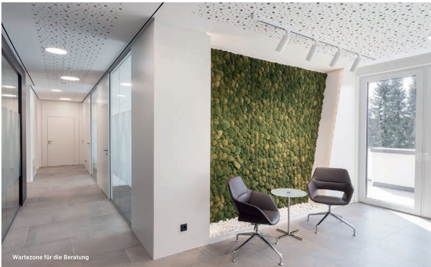
Wartezone für die Beratung