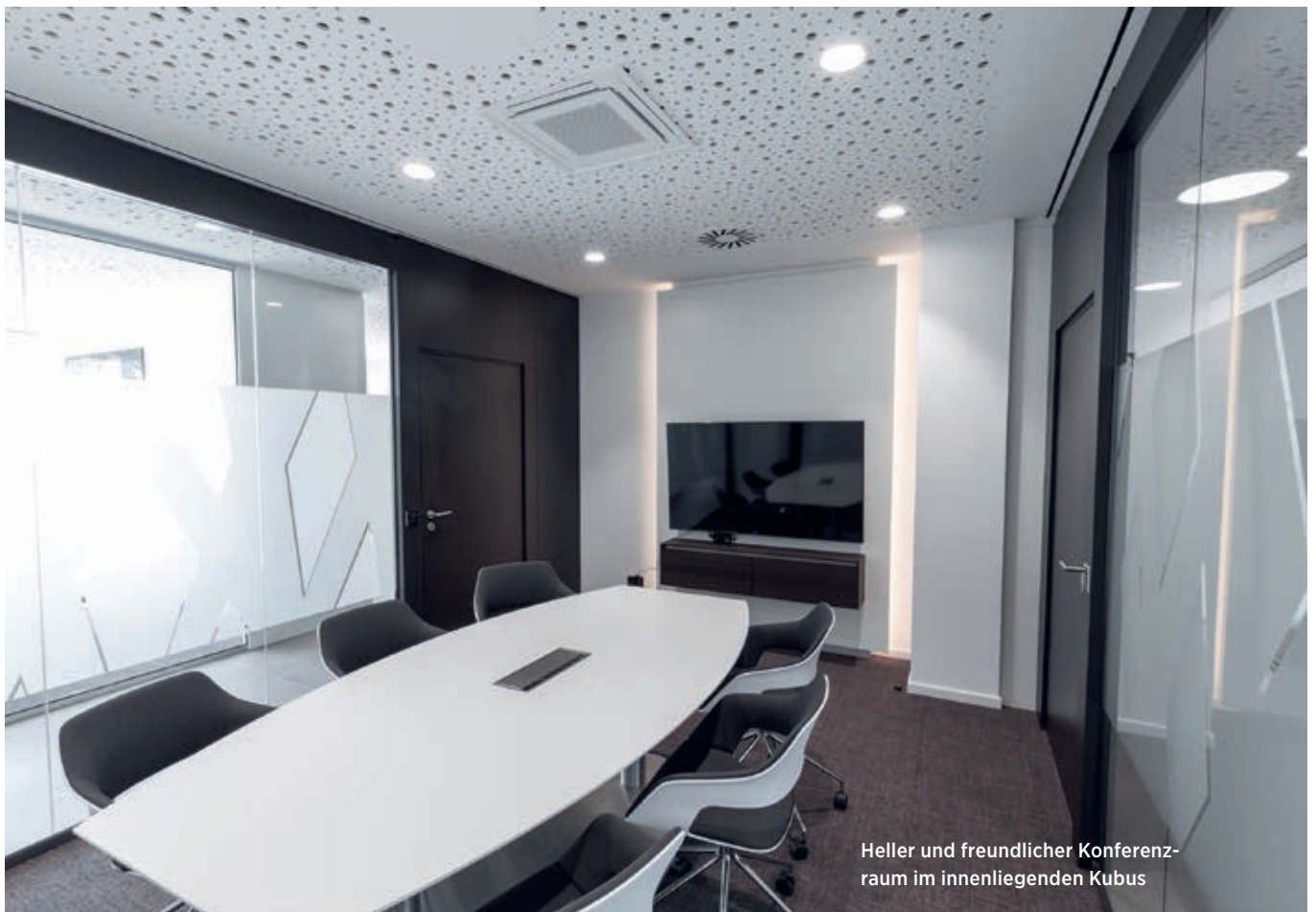
Heller und freundlicher Konferenzraum im innenliegenden Kubus